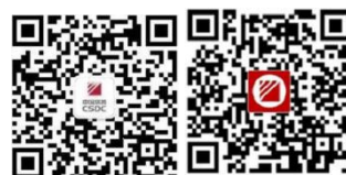
中国结算营业厅 中国结算APP

3.3.1 申请人可提前通过中国结算网上营业厅、“中国结算营业厅”微信公众号、“中国结算”APP 完成业务预约。